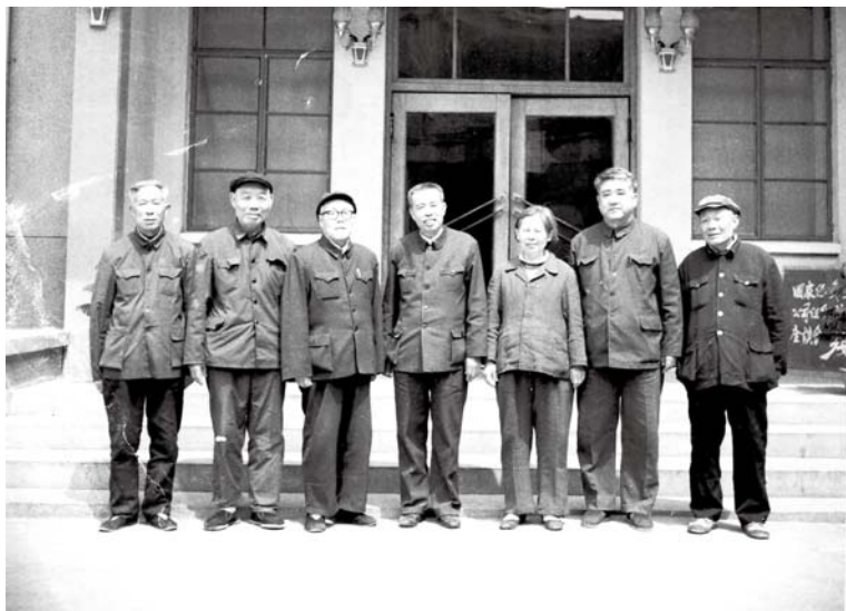
1983年原平汉抗日游击支队部分队员在新乡合影

堡割敌电线3华里，在李士屯一夜锯断电杆4华里；在辉县的百泉、获嘉的狮子营端掉日伪的维持会，枪决维持会长；在卫河上截击日本的汽船，阻断其北上交通；配合陈赓率领的八路军三八六旅进行平汉、道清铁路的破袭战。1938年9月在辉县的枣生村一次解决伪军200人。平汉抗日游击支队还抽出干部20多人到地方开展群众工作，把国民党军队溃散时丢弃在民间的武器收缴起来，组建村自卫队，扩大抗日力量。1938年底，平汉抗日游击支队奉命开往太行山里整训，1939年2月编入八路军一二九师晋东南独立游击支队。这是新乡市域最早由地方党组织的一支抗日武装。