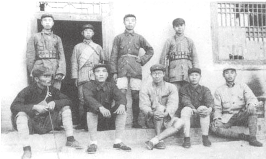
1936年朱瑞（前排左三）在延安